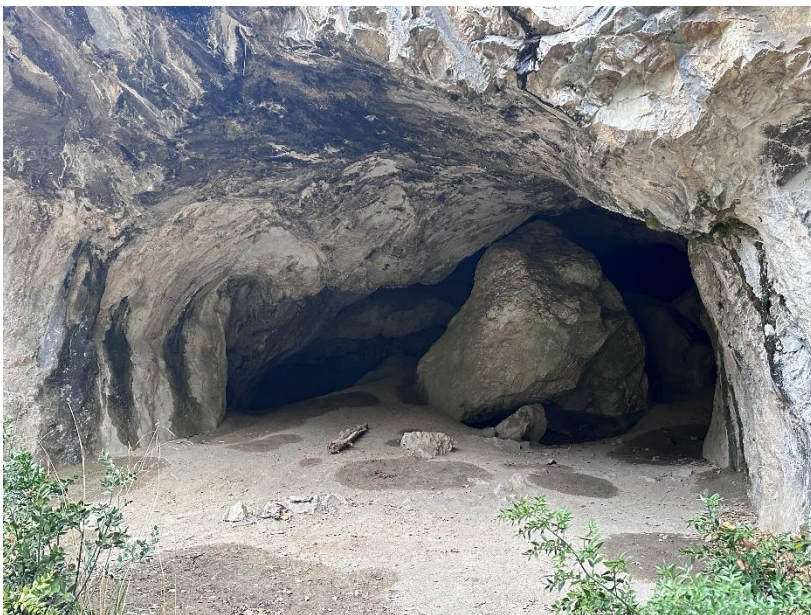
L'entrée de l'Ermité côté nord (entrée Ussat)

En face, un sentier bien marqué monte vers la droite, traverse un éboulis, puis remonte dans les buis et atteint un pied de falaise. Le gouffre de la Vapeur est juste à votre gauche, au pied de la falaise, et il faut poursuivre le sentier en montant jusqu'à la grotte de l'Ermité, entrée nord (ou entrée Ussat). La montée depuis le parking est de 70 m de dénivelé.